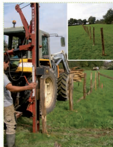
Mise en place de clôtures sur la section « Paray-le-Monial/RD25 »

Comme pour tout chantier routier avant l'arrivée des premiers engins, le programme d'aménagement à 2x2 voies de la RCEA exige des travaux préparatoires de libération des emprises y compris l'archéologie préventive.