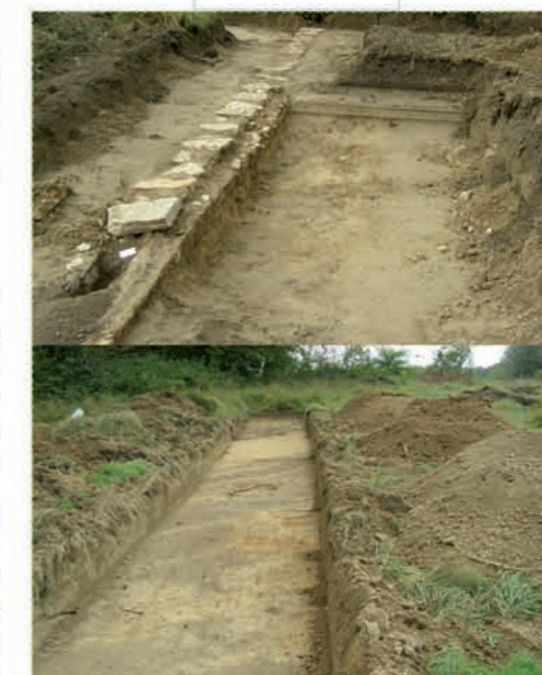
Fouilles archéologiques préventives