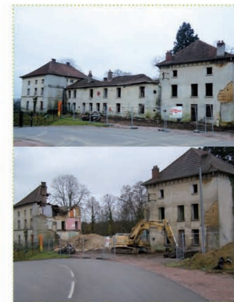
Château d'Avoise avant et pendant déconstruction

Ainsi, le château d'Avoise à Montchanin et un bâtiment agricole à Changy ont été déconstruits fin 2014 après les autorisations et diagnostics réglementaires. Sur les emprises concernées par les premiers travaux 2015 et après consultation des propriétaires des terrains avec l'appui des maires des communes concernées et de la chambre d'agriculture, des clôtures ont été déplacées, des assainissements agricoles rétablis ou bien encore des parcelles nettoyées.