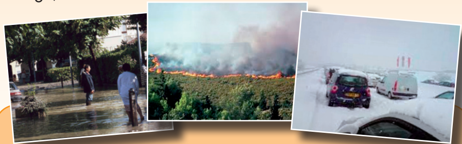
Une réponse pour faire face à ces multiples situations, LE PLAN COMMUNAL DE SAUVEGARDE :