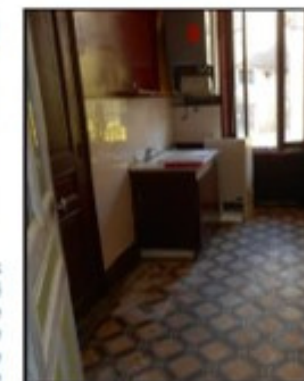
Les appartements après travaux sont méconnaissables.

Il a fallu 10 mois de travaux pour rendre son logement de 70 m 2 comme neuf. L'opération de rénovation du centre-ville lui