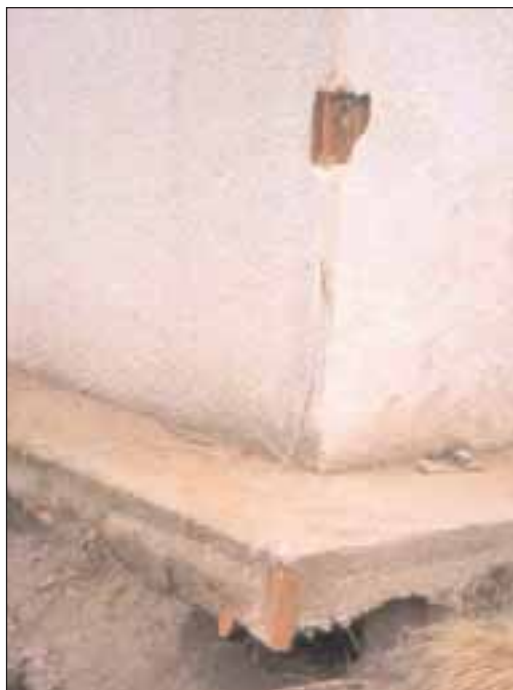
Affouillement des fondations

N'utilisez pas votre téléphone (fixe ou portable) si vous détectez une odeur de gaz, afin de ne pas risquer de déclencher une explosion. Ne buvez pas d'eau du robinet tant que le service local de distribution des eaux ne l'a pas formellement autorisé. Renseignez-vous à la mairie.