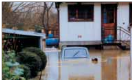
Crue de l'Oise de 1993

Profitant de la détresse des victimes, des personnes mal intentionnées tentent d'agir à vos dépens (faux démarcheurs, ...).