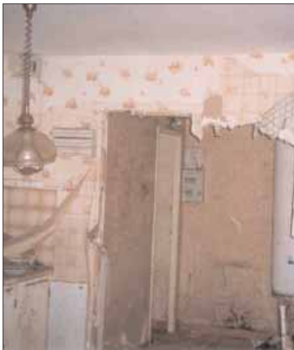
Cloison détruite par une inondation torrentielle

chement des locaux inondés. Interrogez votre assureur, ou l'expert qu'il aura désigné, pour connaître les conditions d'une éventuelle prise en charge de l'intervention de ces entreprises. Le nettoyage de la surface des murs avec de l'eau additionnée d'eau de javel peut avoir lieu durant le processus de séchage : la quantité d'eau ainsi utilisée est faible par rapport à celle apportée par l'inondation.